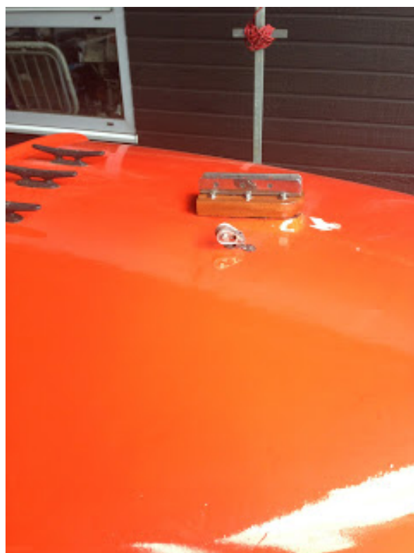
[ http://1.bp.blogspot.com/-JT-0njfiKE/UauBnUywUMI/AAAAAAAAANA/21ejVlq5m6k/s1600/IMG_0255.jpg ]