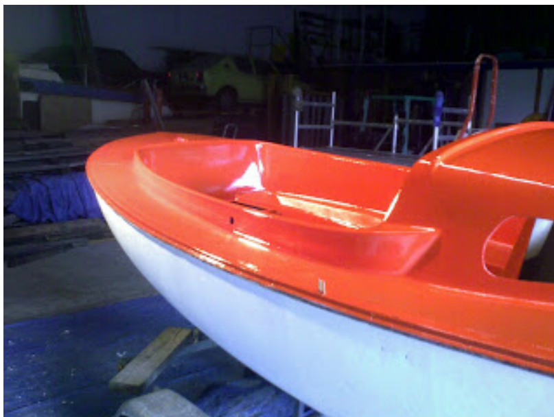
[ http://3.bp.blogspot.com/-quhtQQoDM_E/UFTTZPt6ghI/AAAAAAAAAH4/EAxNi5HIqxE/s1600/15092012062.jpg ]

Daarna ook de romp in de lak gezet (kleur RAL9001 crème wit De IJssel). Dit ging een stuk sneller en makkelijker. De verf dekt goed en trekt mooi glad weg. Helaas zijn niet alle onregelmatigheden uit de romp te krijgen, mede doordat een aantal plekken flink geschuurd zijn waardoor de romp niet helemaal egaal meer is.