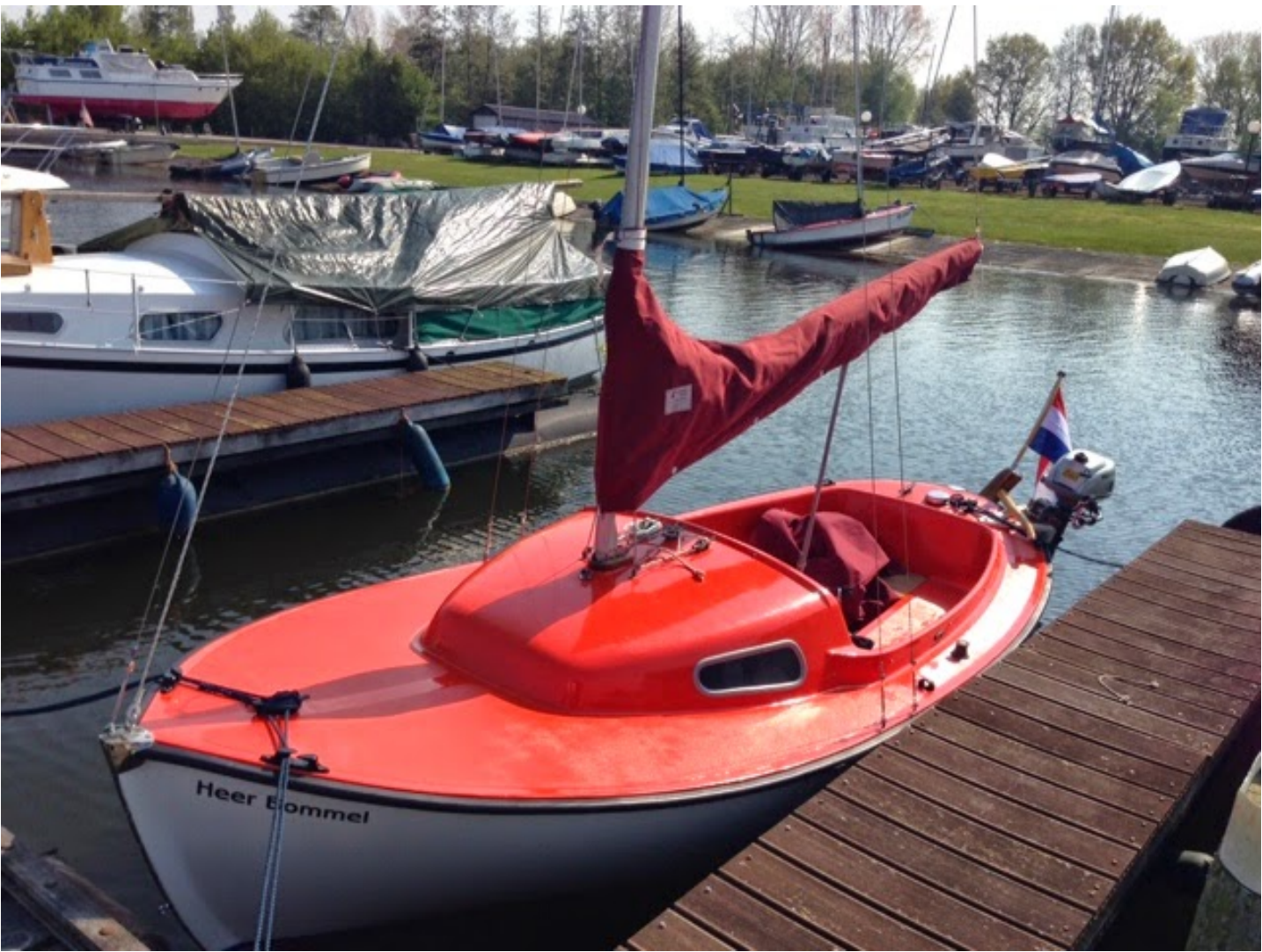
[ https://lh6.googleusercontent.com/-2VvNCp7TeGE/U5dDbarNGil/AAAAAAAAAVQ/XxEwKoevYTM/s640/blogger-image--2111638125.jpg ]