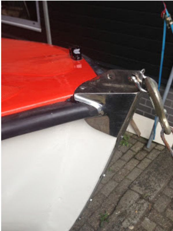
[ http://2.bp.blogspot.com/-_WFcw8Orb0s/UauBlb-2H7I/AAAAAAAAAMs/d_ttN0VXMtk/s1600/IMG_0254.jpg ]

Hieronder nog wat foto's van de laatste dingen die zijn aangebracht: