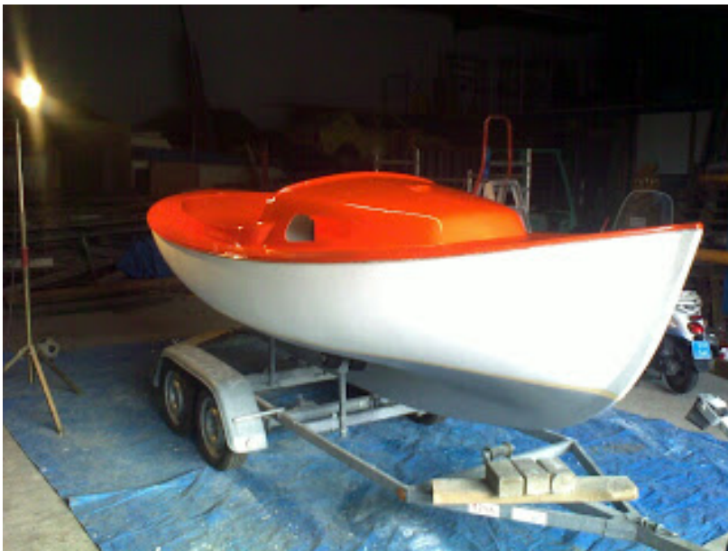
[ http://3.bp.blogspot.com/-qrq-vfp--yc/UFTTX0Nd_WI/AAAAAAAAAH0/oLI73rf6kVo/s1600/15092012061.jpg ]

Hieronder de eerste foto's van het dek en kajuit in de eerste laklaag;