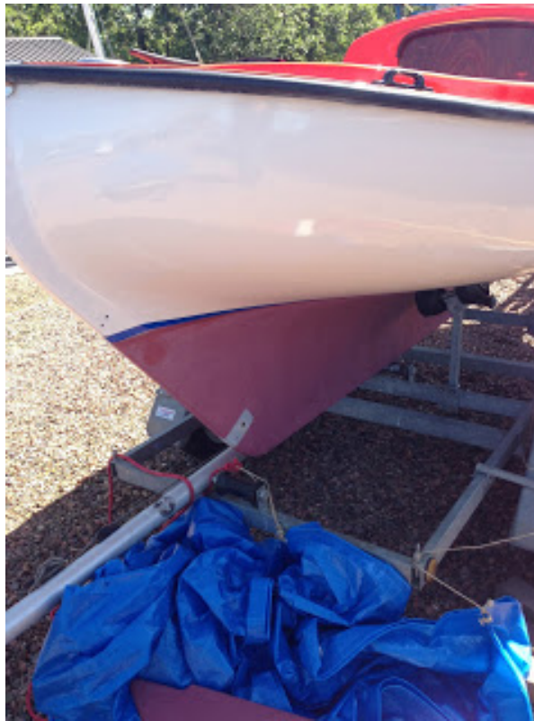
[ http://3.bp.blogspot.com/-0qzUSqul6QA/UauDLSPld1I/AAAAAAAAANc/cySwQVbRUOA/s1600/IMG_0268.jpg ]