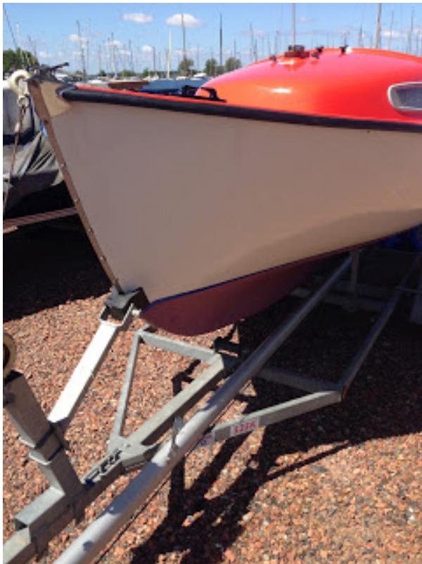
[ http://2.bp.blogspot.com/-3wR9Jh221zE/UauDLqBHGVI/AAAAAAAAANY/AgsFL06YEoo/s1600/IMG_0269.jpg ]