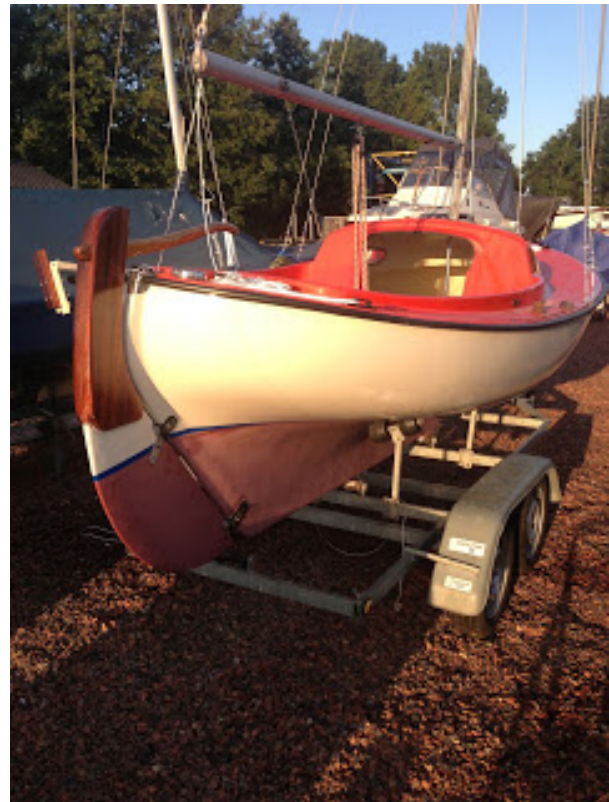
[ http://2.bp.blogspot.com/-2iO3l5pGZ8o/UcxZDqBNMzI/AAAAAAAAAOc/m12AyhF_1Zk/s1600/IMG_0311.jpg ]