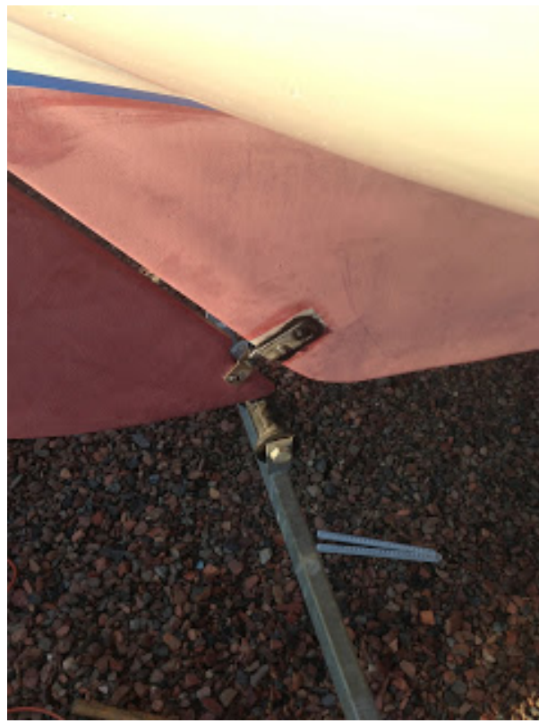
[ http://4.bp.blogspot.com/-hSPdHqACp0Y/UcxZCl5MC5I/AAAAAAAAAOA/KrOoEgpJLn0/s1600/IMG_0310.jpg ]