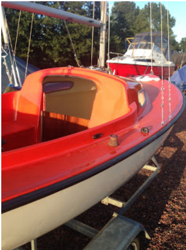
[ http://2.bp.blogspot.com/-QK-R21YCVtg/UcxZD41n-el/AAAAAAAAAOg/6PvVHHMnsos/s1600/IMG_0313.jpg ]