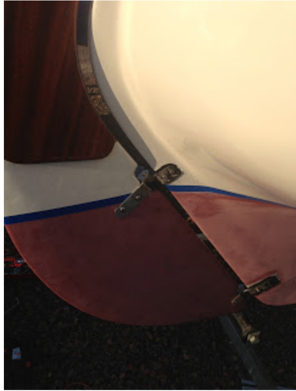
[ http://2.bp.blogspot.com/-7nN0Kg5QbFw/UcxZCgC3LDI/AAAAAAAAAOE/PXKaUiQhdbY/s1600/IMG_0309.jpg ]