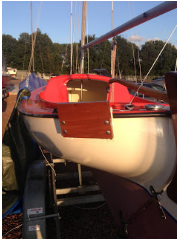
[ http://4.bp.blogspot.com/-8BddTvfU3Qk/UcxZDs60KRI/AAAAAAAAAOY/LC6hEsWD3_M/s1600/IMG_0312.jpg ]